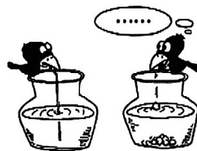
乌鸦喝水（作者：薛宏）