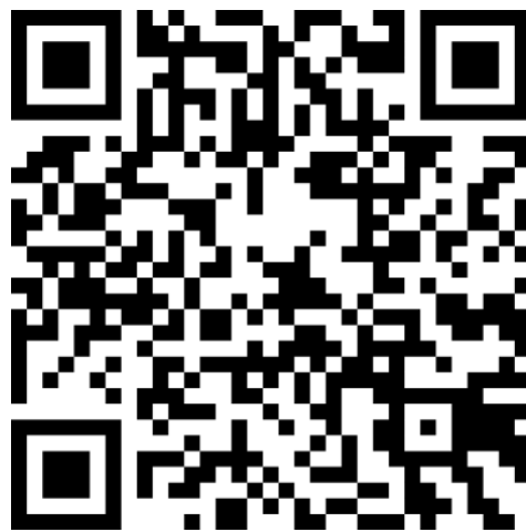
新增中学信息二维码

同时，请点击链接 https://xjtu.jinshuju.com/f/BAz7Gz 或扫描二维码填写中学信息，由我办协调添加，预计约需 3 个工作日。